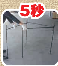
スタンドを広げます。