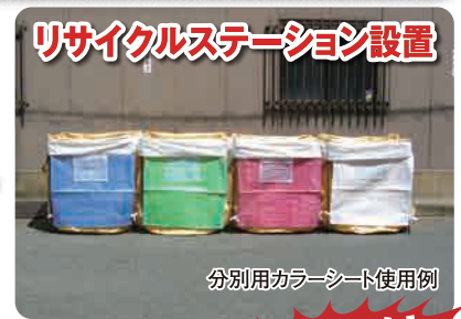
分別用カラーシート使用例

付属 分別用カラーシート ツータッチスタンド1セットにつき 1枚付属しています。 5色からお選びいただけます。