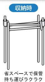
省スペースで保管 持ち運びラクラク