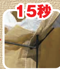
バッグの本体上部をスタンドの突起に合わせ折り返します。