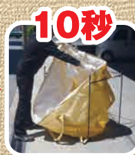
リレーバッグを広げます。