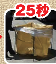
同様に4方を折り返します。