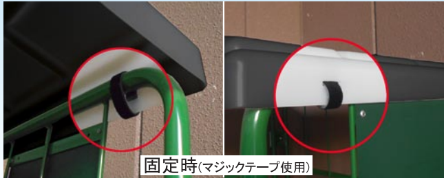
固定時(マジックテープ使用)