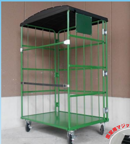
リレーカーゴ装着時