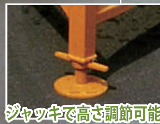
ジャッキで高さ調節可能