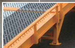
安心のサイドガード