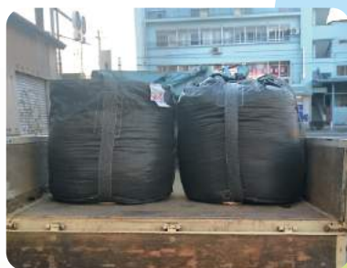
4ナンバートラック並列積み