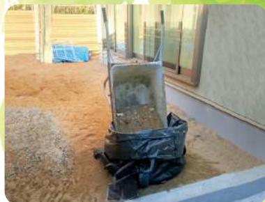
一輪車で投入しやすい本体高さ 砂の汚れも目立ちにくい