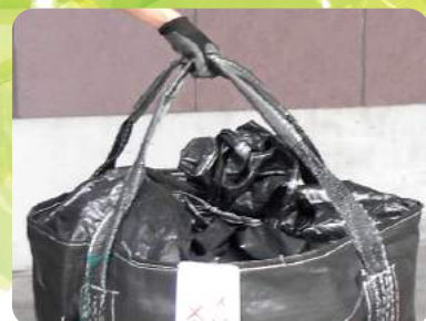
便利な長めの吊りベルト