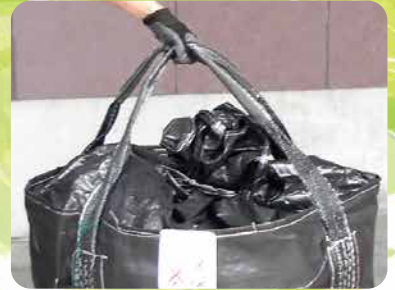
便利な長めの吊りベルト