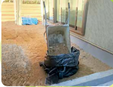
一輪車で投入しやすい本体高さ 砂の汚れも目立ちにくい