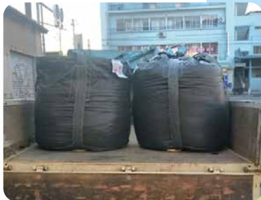
4ナンバートラック並列積み