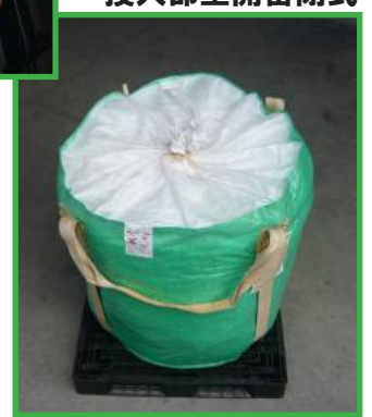
底部から しっかりホールド