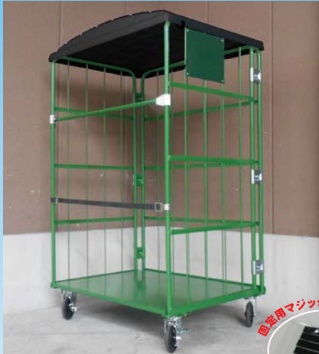
リレーカーゴ装着時