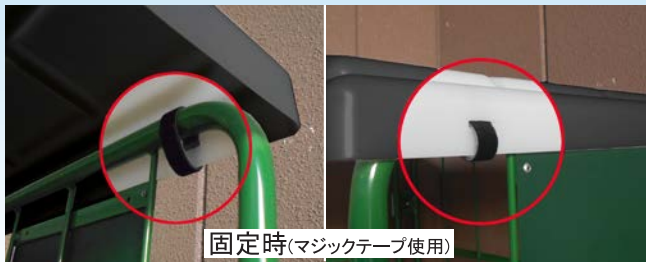
固定時(マジックテープ使用)